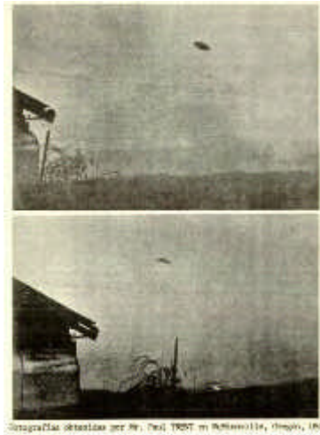
Fotografías obtenidas por Paul Trent en McMinnville, Oregon, EEUU.

realmente un aparato discoidal de naturaleza desconocida. Por el contrario, si el análisis de los datos arriba a un resultado negativo, el OVNI deberá ser considerado como un modelo en escala reducida, de menos de veinte centímetros de diámetro.